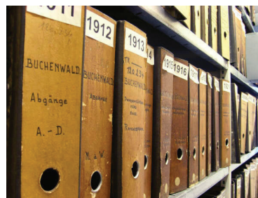
Foto classeurs, SVG-DOS